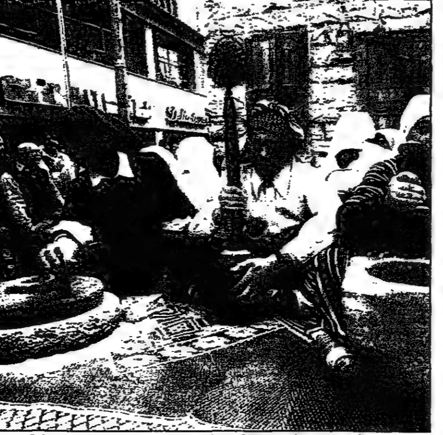
قرويات لينيات وبعض الاموال للزيادة التقليدية في شرف فريمان بوسه بيوت في حتم مهرجان التسوق امس

الخرطوم - رويترز - قالت شركة بتروليس للنفط والغاز امس الأحد ان كونسورتيوم يضم أربع شركات نفط عالمية وافق مع الحكومة السودانية للتفتيح عن النفط في منطقة حوض الجبل بالسودان.